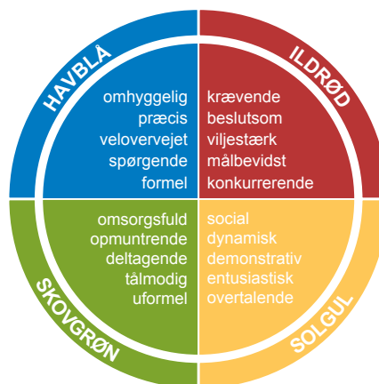
Insights Discovery Wheel: 4 typer

Underholdende og fascinerende introduktion til Insights Discovery – som bider sig fast.